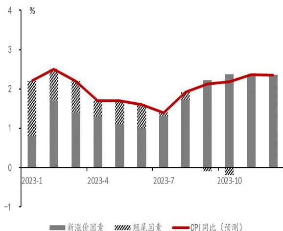
图 1：2023 年 CPI 同比走势及预测