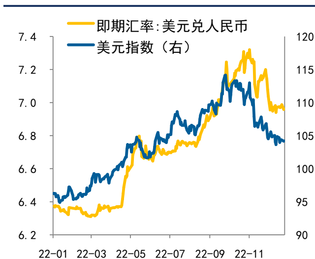
图表 1：美元指数下跌

第三，国内疫情防控和房地产调控政策进一步优化，经济复苏预期升温。11月11日，国务院联防联控机制综合组印发优化防疫二十条措施，进一步优化了疫情防控；11月25日，央行宣布再次降准0.25个百分点，共计释放长期资金约5000亿元，缓解银行流动性压力；11月28日，证监会宣布调整优化上市房企股权融资5项措施，被业内称为“第三支箭”正式落地；12月7日，国务院联防联控机制综合组发布新十条，加快推动经济社会活动回归正轨，市场信心得到提振。