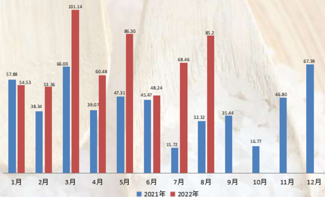
2021-2022 年度中国原盐进口量统计 (单位: 万吨)