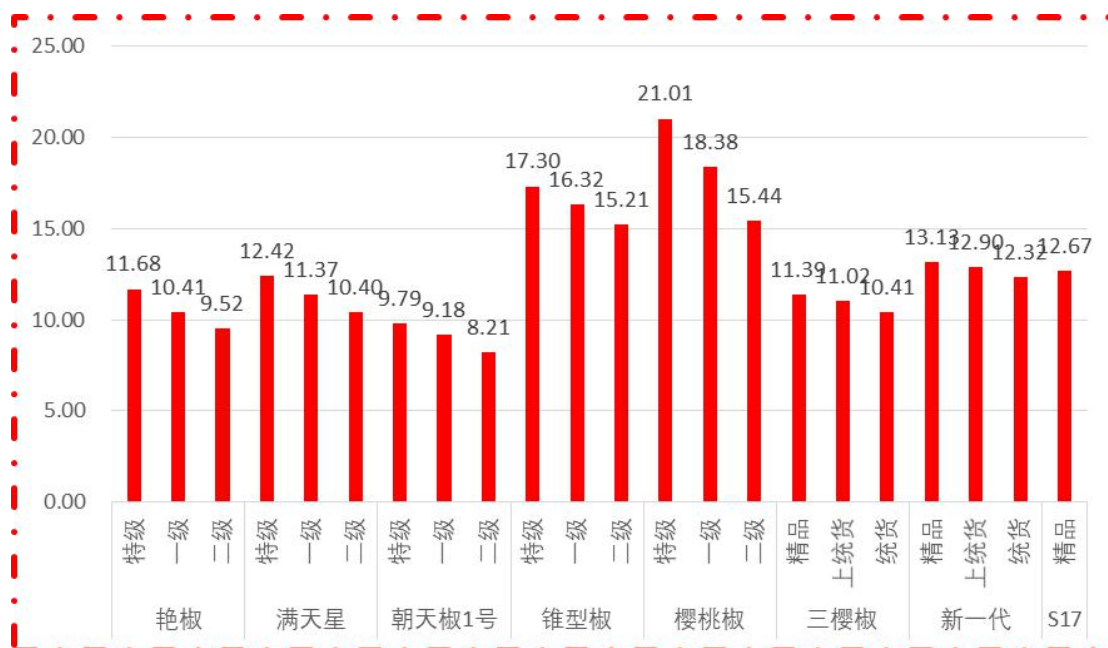
图 1 各品种、各等级周度均价