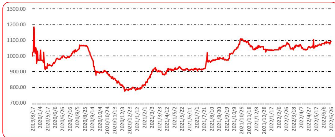
图 9 新一代（干椒）批发价格指数运行图