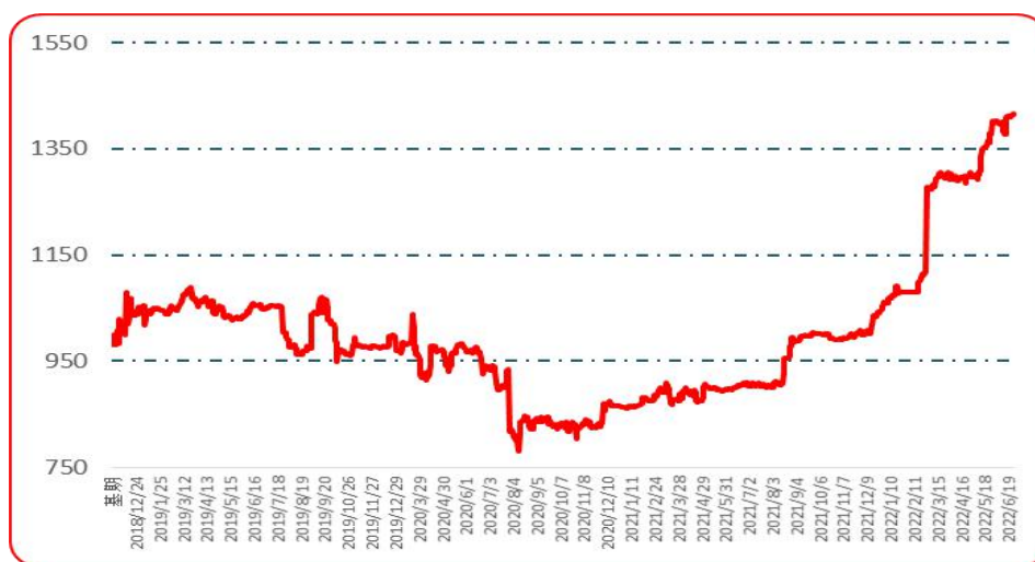
图 7 樱桃形椒批发价格指数运行图