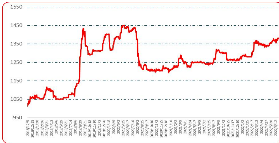
图 2 中国遵义朝天椒（干椒）批发价格综合指数运行图