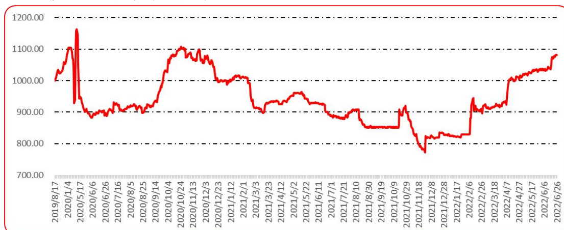
图 10 印度进口椒批发价格指数运行图