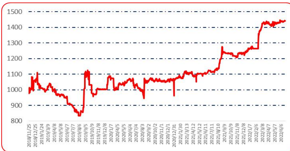
图 6 锥形椒批发价格指数运行图