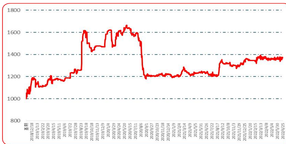
图 3 艳艳批发价格指数运行图