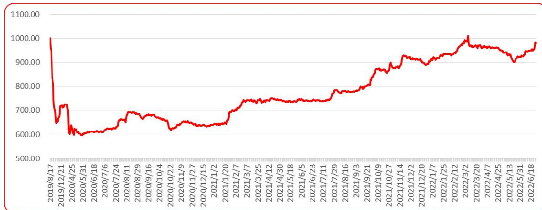
图 8 三樱椒（干椒）批发价格指数运行图