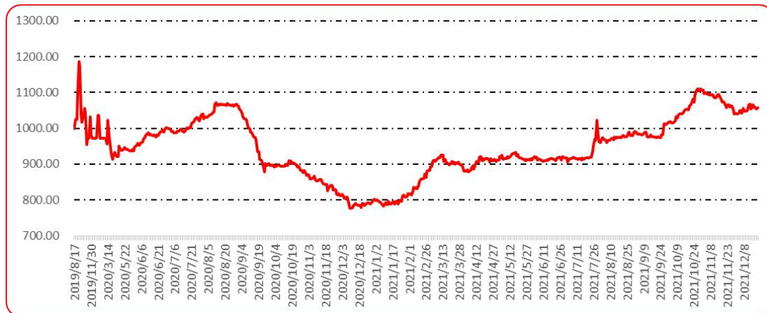
图 9 新一代（干椒）批发价格指数运行图