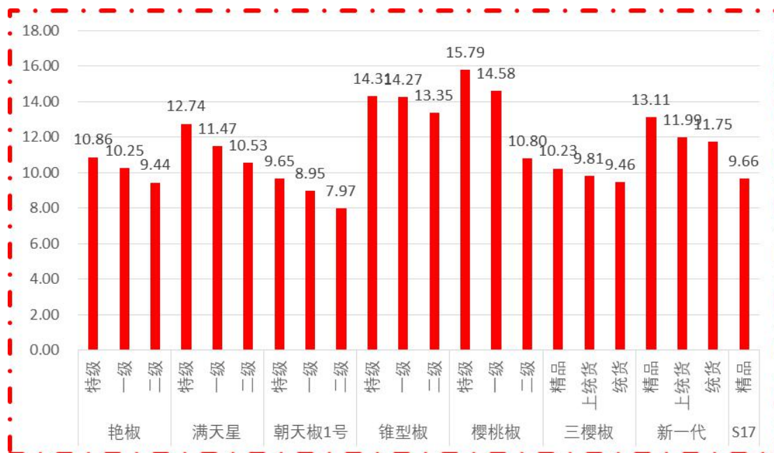
图 1 各品种、各等级周度均价