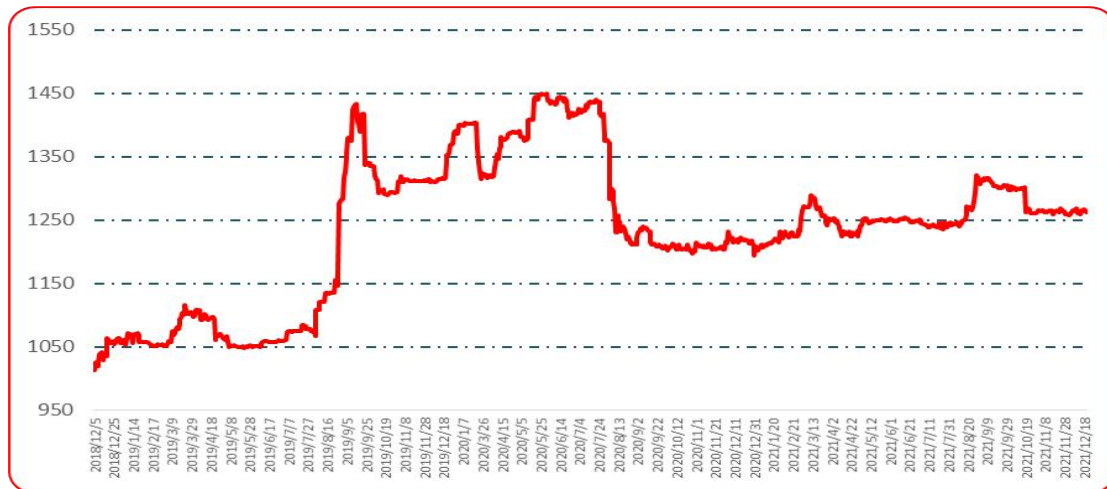
图 2 中国遵义朝天椒（干椒）批发价格综合指数运行图