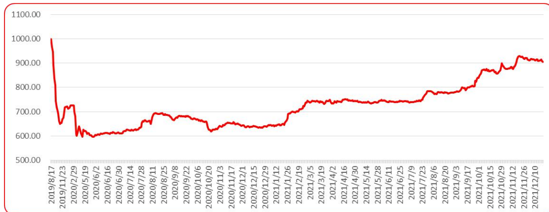
图 8 三樱椒（干椒）批发价格指数运行图