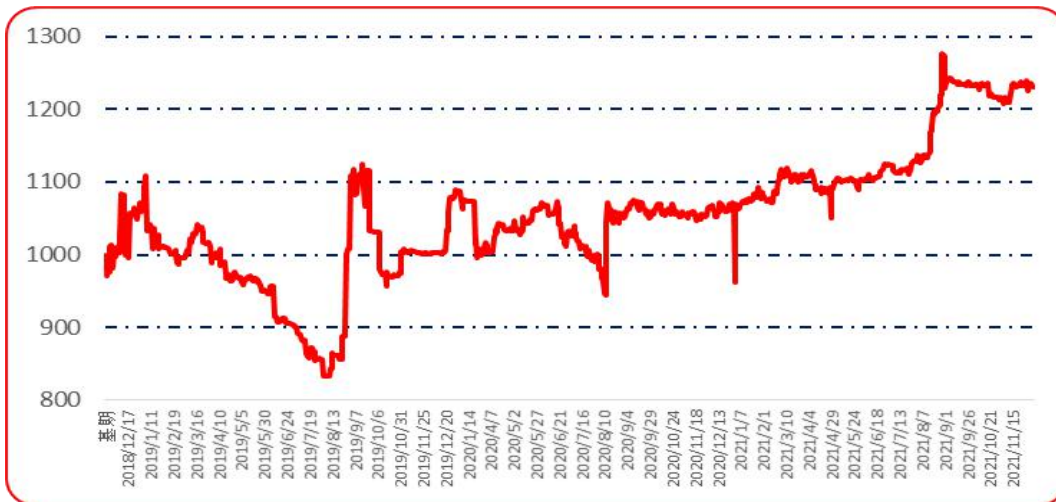
图 6 锥形椒批发价格指数运行图