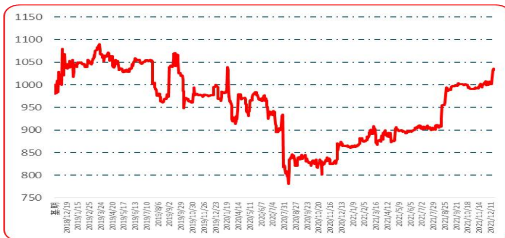
图 7 樱桃形椒批发价格指数运行图