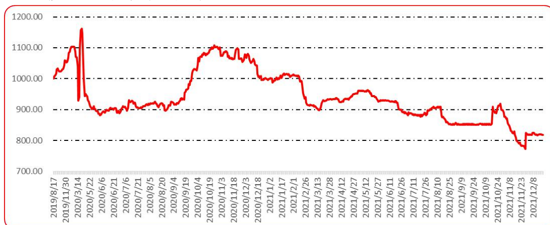
图 10 印度进口椒批发价格指数运行图