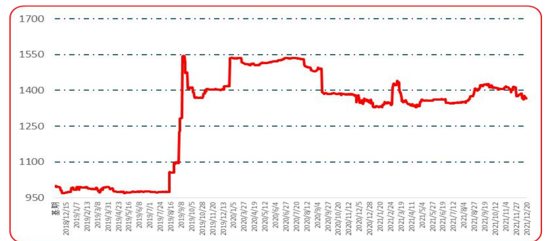
图 4 满天星批发价格指数运行图