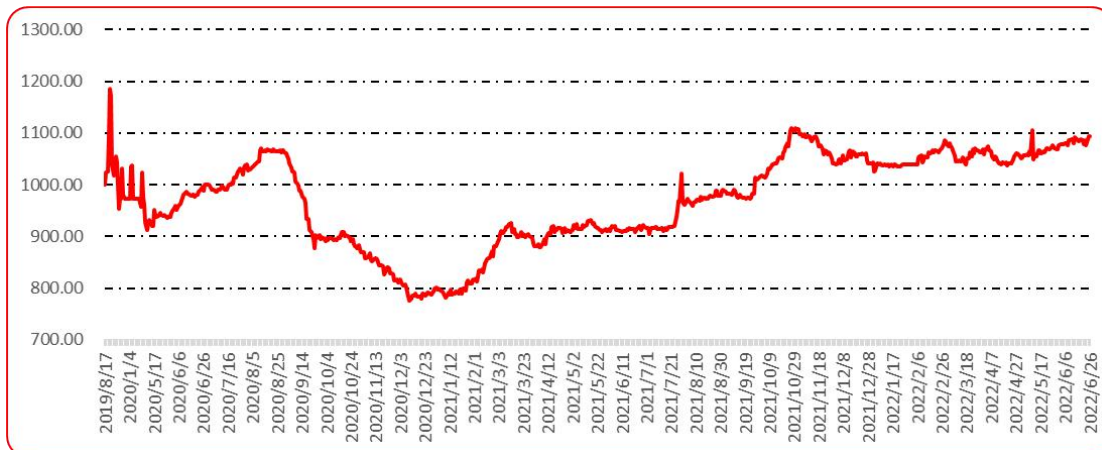
图 9 新一代（干椒）批发价格指数运行图