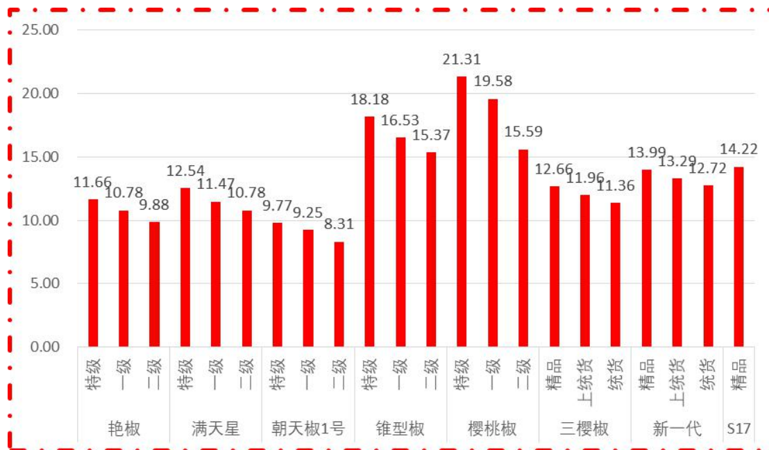
图 1 各品种、各等级周度均价（数据来源：新华指数）