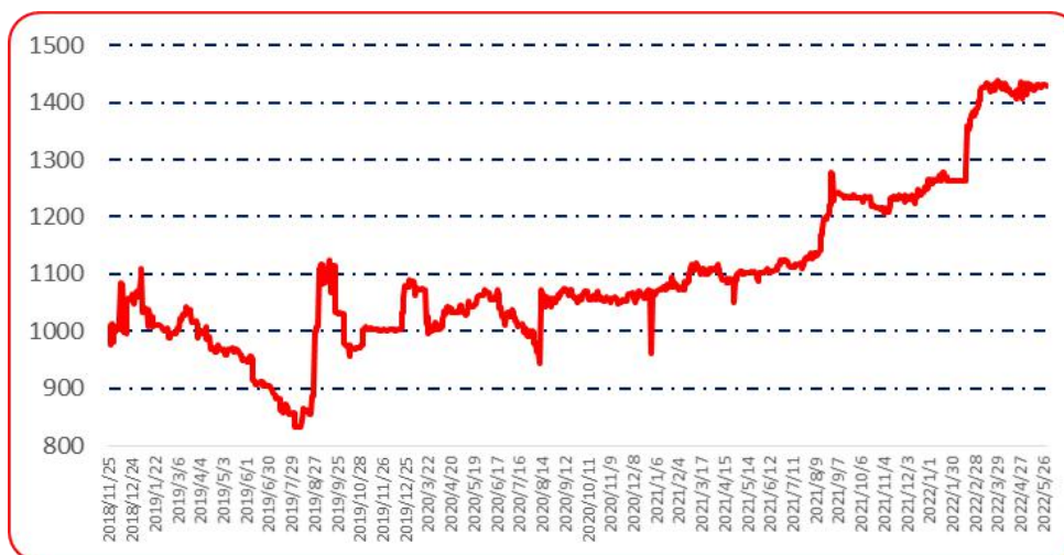
图 6 锥形椒批发价格指数运行图