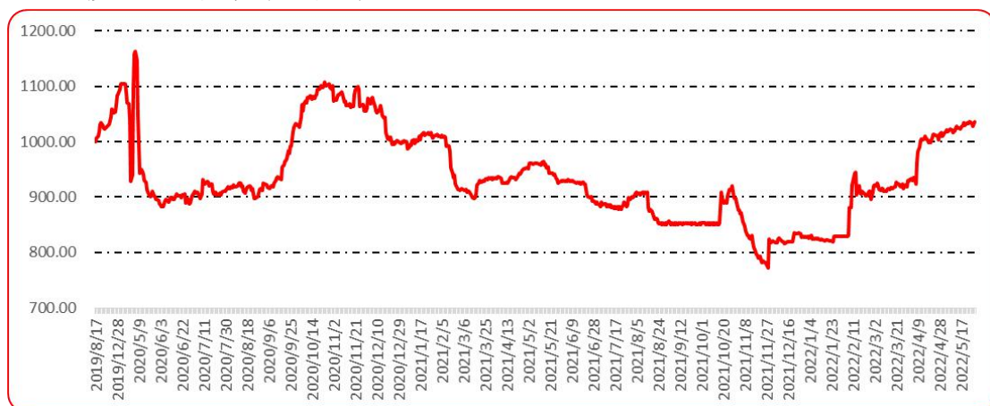
图 10 印度进口椒批发价格指数运行图